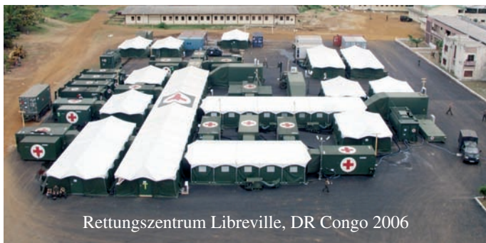
Rettungszentrum Libreville, DR Congo 2006

In der Vollkonfiguration wird das Kdo SES mit über 1.700 Soldaten und Soldatinnen 3 Luftlanderettungszentren (LSE), 8 Luftlanderettungszentren leicht (LSE), 3 Rettungszentren (MSE) und 3 Rettungszentren leicht (MSE) bereit halten.